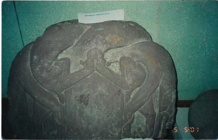
Fotoğraf 2: Ak-Beşim'den Burana Müzesi'ne getirilen Çift Başlı (simetrik) Bozkurt Motifli Kitabe Başlığı