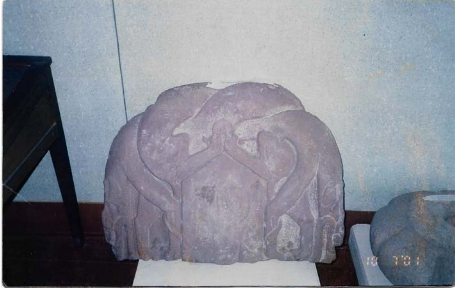
Fotoğraf 1: Ak-Beşim'den Burana Müzesi'ne getirilen Çift Başlı (simetrik) Bozkurt Motifli Kitabe Başlığı