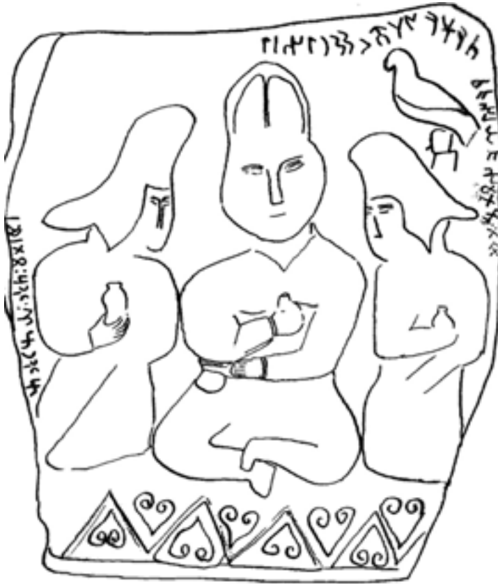
Şekil 1. İhe Ashete Yazıtı A1 Ön Yüzü