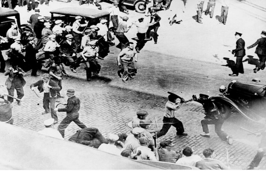
Fotoğraf 1: Sınıf Savaşı; Minneapolis’te İşçiler ve Polis Çatışıyor 3

letler için de; emek nihai hedef hâline geldi. Böylece ‘sermaye için sermaye’ gibi paradoksal bir döngü de oluşabilmiştir. İşçiler ve hak sahipleri arasındaki sınırın ve hangi tarafın nerede kalacağına kararını, emek çatısını kuran iktidar vermiştir. Bu açıdan özellikle aile kurumu modernize edilerek tekrar kullanılmıştır. 1980’lerde bu politikanın İngiltere’de de uygulandığını görüyoruz (Schwarz, 2015). Thatcherizm “yeni emek” söylemi altında bilgi-temelli bir ekonomiyi ve aile-tüketim-emek üçgenini hedeflemiştir.