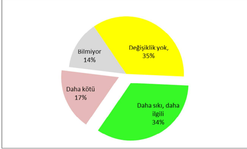
Grafik 1: Devletin ormana bakışında değişiklik hissedip hissetmedikleri